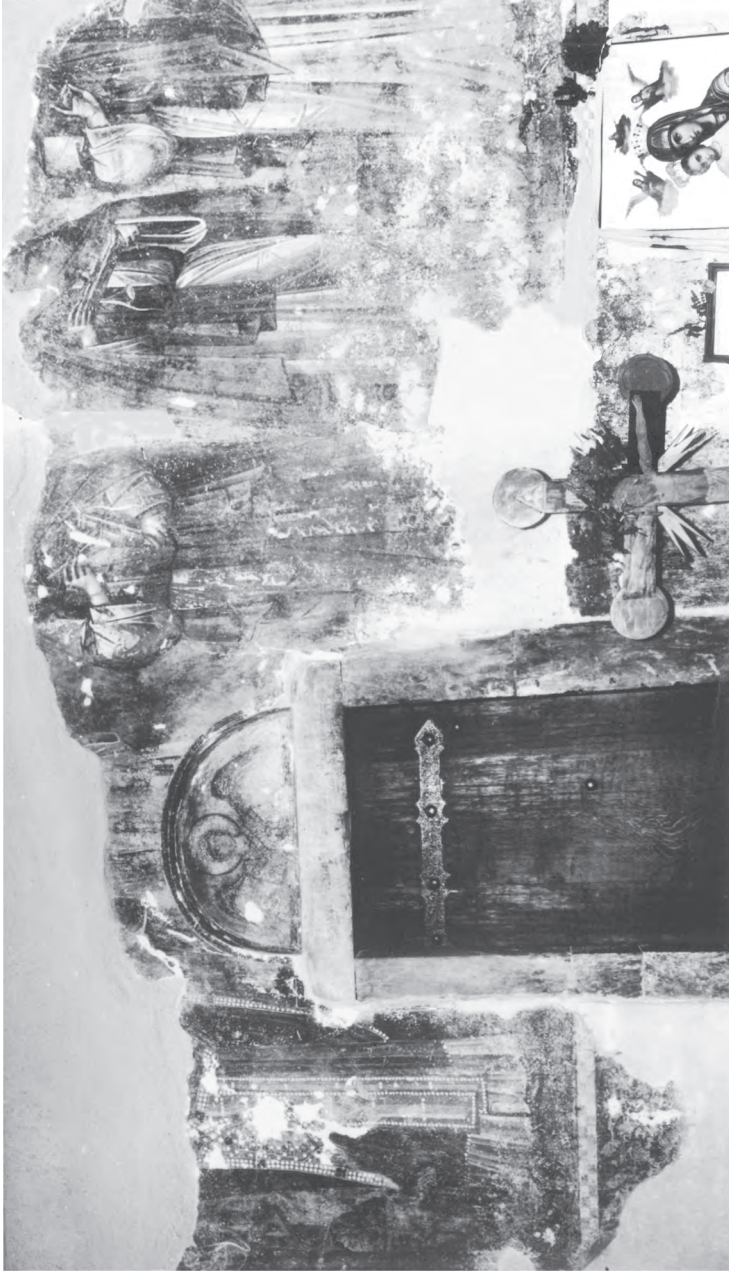
Сл. 7. Жича, црква Вазнесења Христовог, некадашња припрага, северни зид (без фигури у западном крају зида): свети монаси-песници и допојасни лик неидентификованог светог монаха; преи слева: свети Теодор Студит (компјутерски спојена два снимка РЗСК)