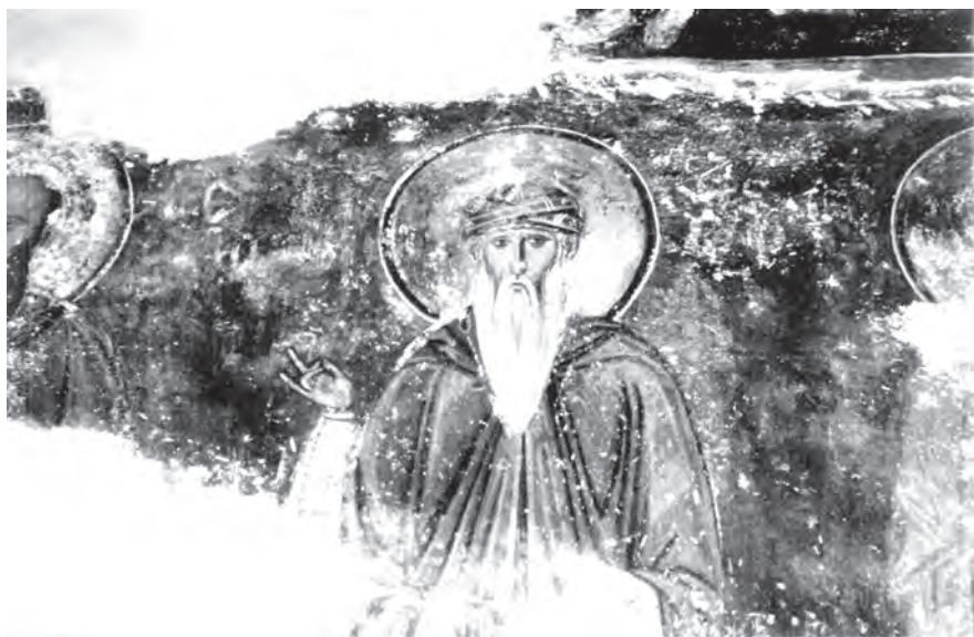
Сл. 6. Студеница, црква Успења Богородичиног, јужни вестибил-певница, део западног зида са ликовима светих монаха-песника; у среди-ни: свети Теофан Грапт