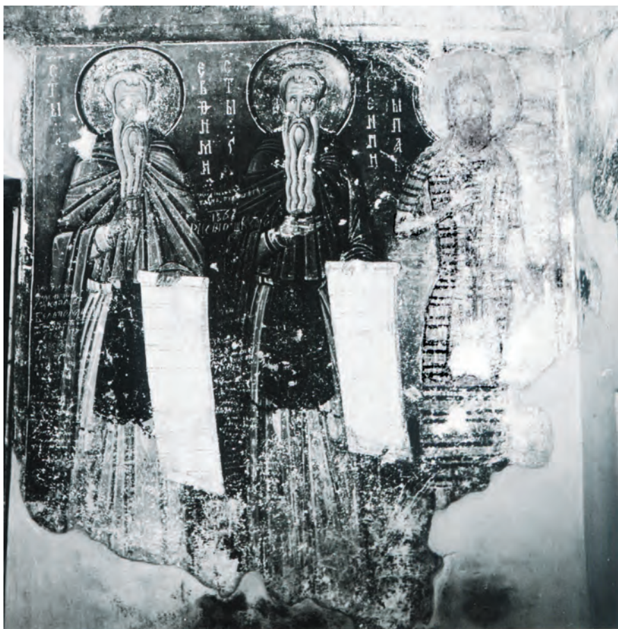
Сл. 4. Милешева, црква Вазнесења Христовог, западни зид припрате, северна половина: св. Левтимије, св. Арсеније и св. Павле Тивејски (Легат Душана и Ружице Тасић, Филозофски факултет, Београд)