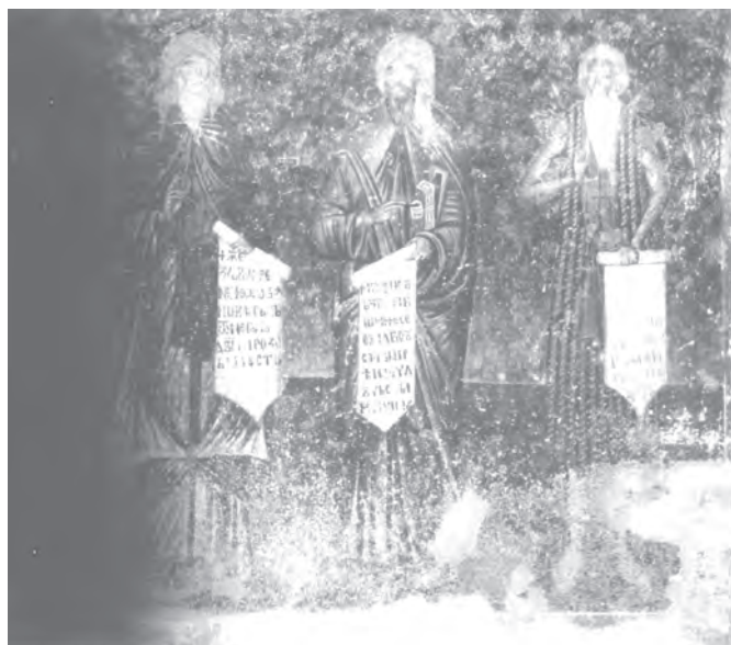
Сл. 10. Сопоћани, црква Свете Тројице, припрата, западни зид, јужна полови- на: свети мо- наси-песници Козма Мајум- ски и Јован Да- маскин, свети Павле Тивеј- ски