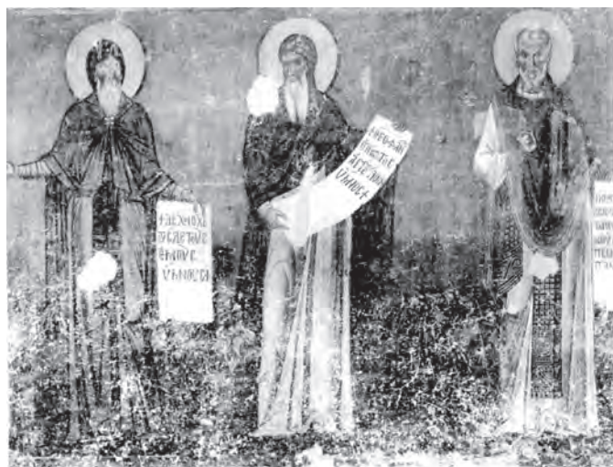
Сл. 5. Нерези, црква Св. Пантелејмона, поткуполни простор наоса, северна страна, део групе светих монаха-песника: свети Јосиф Песник, свети Теофан Грапт и свети Теодор Студит