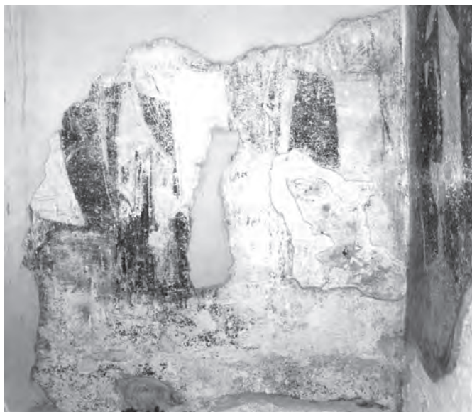
Сл. 2. Милешева, црква Вазнесења Христовог, јужни зид припрате, западна половина: ликови светих монаха-песника; у средини: св. Теодор Студит