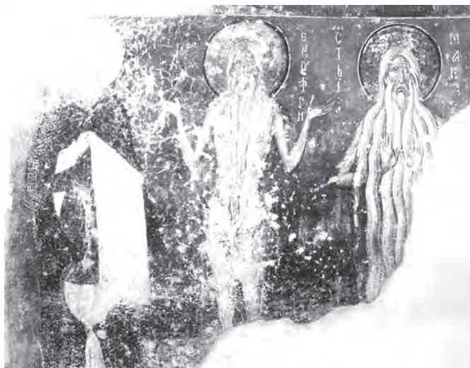
Сл. 3. Милешева, црква Вазнесења Христовог, западни зид припрате, јужна половина: лик из групе светих монаха-песника (?), св. Онуфрије и св. Макарије