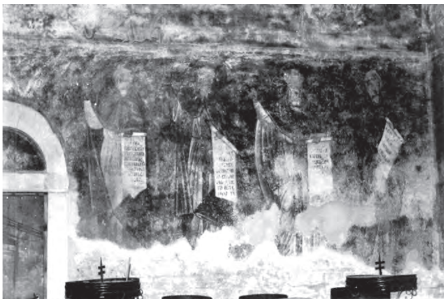
Сл. 9. Сопоћани, црква Свете Тројице, припрата, јужни зид: ликови светих монаха-песника; други здесна: свети Теодор Студит