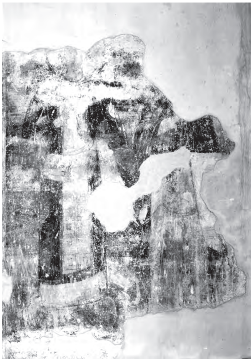
Сл. 1. Милешева, црква Вазнесења Христовог, јужни зид припрате, источни део: лик византијског цара и светог монаха из групе црквених песника